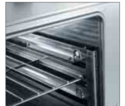
Ugn i rostfritt stål (AISI 430)