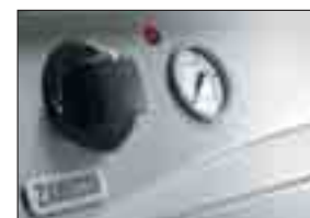
Kontrollpanel med manometer