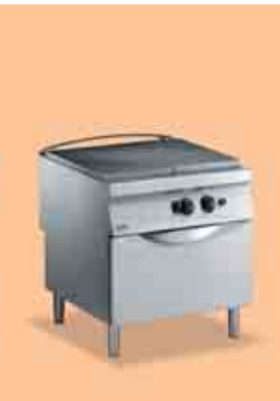
Hela släta hällar