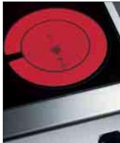
Två koncentriska värmezoner