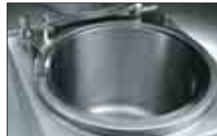
Djupdragen rostfri gryta