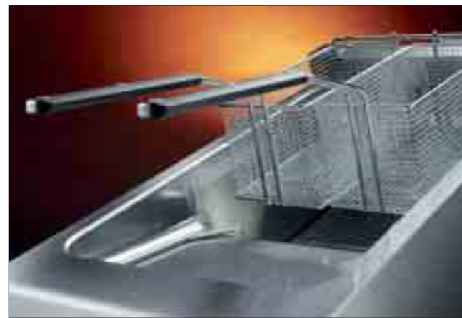
Bred expansionsyta för oljan

Fritöserna i N900 serien kännetecknas av deras utomordentliga prestanda och höga effektivitet. Faktum är att temperaturen omedelbart återgår till den inställda. Konstruktionen av dom "V" formade bassängerna i rostfritt stål (AISI 304) med en bred expansions yta för oljan, tillåter optimalt värmeutbyte, så att oljan räcker längre. Värmeelementen som är placerade på utsidan av bassängen, dom runda hörnen och utan svetsställen gör dem mycket lätta att rengöra, enligt den striktaste hygienstandarden. Arbetstemperaturområdet är från 120°C till 190°C på gas modellerna och från 105°C till 190°C på dom elektriska modellerna. Med hjälp av ett inbyggt tömningssystem, sker oljetömningen via en kran till en inbyggd behållare som är placerad under bassängen i Active och i de elektroniska modellerna med oljeåtervinning. Detta förenklar hanteringen av använd olja och garanterar säkerheten för operatören. Gasmodellerna har rostfria (AISI 304) brännare som är utrustade med en thermocouple säkerhetsventil, medan de elektriska modellerna har rostfria värmeelement Incoloy 800 (modeller med 18 liter bassäng) och värmeträlningsplattor (modeller med bassäng från 15 till 23 liter) och är försedda med en säkerhetstermostat. Piezotändning.