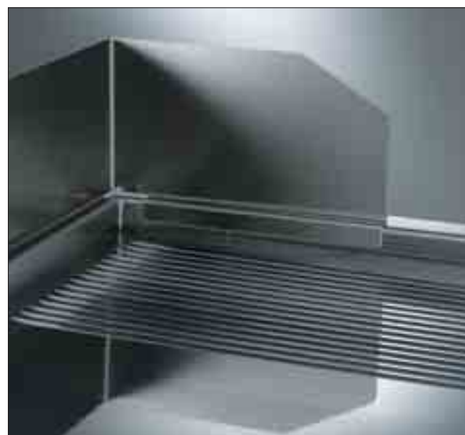
Inbyggd häll med stänkskydd

N900 stekhällar är konstruerade för att garantera snabb uppvärmningstid, en jämn värmefördelning och låg värmeavgivning. Den inbyggda vattentäta konstruktionen på stekhällarna finns i kolstål och krom, utförandet är antingen slät eller räfflad. Hällen är utrustad med stort dräneringshål med 3 liters droppskål under hällen för uppsamling av överblivet fett. Modeller med en horisontell häll är också tillgänglig. Denna häll är idealisk för tillagning av såser. En hermetisk tättslutande plugg för stekhällens dräneringshål är inkluderad och denna är mycket värmestålig. Tjockleken på hällen (15 mm), hög effekt, upp till 20 kW för gas modellerna och upp till 15 kW för dom elektriska modellerna, garanterar en konstant och idealisk tillagningstemperatur, även under intensiv användning. Arbetstemperaturområdet ligger mellan 110°C till 270°C. Den stabiliserade brännaren med 4 flamspridare är utrustad med en thermocouple säkerhetsventil för gas modellerna medan dom elektriska modellerna har rostfria värmeelement (incoloy 800) som är försedda med en säkerhetstermostat. Piezotändning. Stänkskydd i rostfritt stål (AISI 304) och skrapor med slät/räfflat blad medföljer som standard.