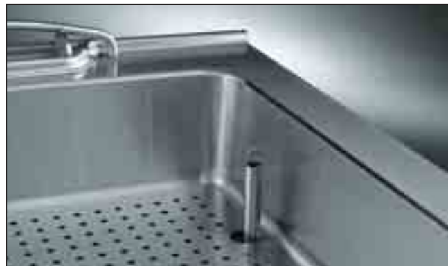
Bassäng med perforerad lös botten och bräddavlopp

Vattenbadet i N900 serien är försedd med automatisk temperaturkontroll med termostat från 60°C till 90°C. Bassängen är utrustad med rundade hörn och kanter vilket förenklar rengöring och tömning av vatten. Bassängmåttan GN anpassade för 1/1 + 1/3 kantiner med max djup 150 mm. Vattenbadet är också utrustat med en perforerad lös botten och gejdrar för GN kantiner. Tömningen sker med hjälp av bräddavloppsror. Brännarna har optimerad förbränning och är försedda med thermocouple säkerhetsventil och en skyddad pilotlåga.