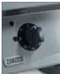
Kontroll vred för temperatur

Gas eller elektrisk 800 mm modeller med ugn och med en slät häll i kolstål och lutande