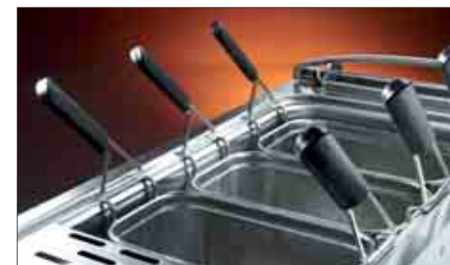
Bassäng med rundade hörn

Gas, elektrisk eller ånguppvärmda modeller med 2 bassänger, 190 liter, med automatisk korglyft