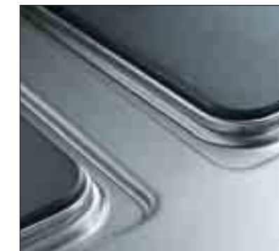
Slät pressad häll

Den elektriska ugnen har en hög standard med en effekt på 6 kW och en arbetstemperatur från 100°C till 300°C. Robusthet och enkel rengöring är garanterad av att ugnsutrymmet är i rostfritt stål (AISI 430). Isoleringen är garanterad av den 40 mm tjocka ugnsluckan. Ugnen är utrustad med tre gejderpar i rostfritt stål (AISI 430) anpassade för GN 2/1 galler. För förbättrad ergonomi är kontrollvreden placerade på den övre frontpanelen. För att garantera jämn tillagningstemperatur är ugnen försedd med en 5 mm tjock räfflad gjutjärns botten. Ventilen för klimatkontrollen garanterar alltid perfekt tillagning. Tre tillagnings möjligheter är tillgängliga, effektiv värmeöverföring från undersidan, grillning och en kombination av bägge.