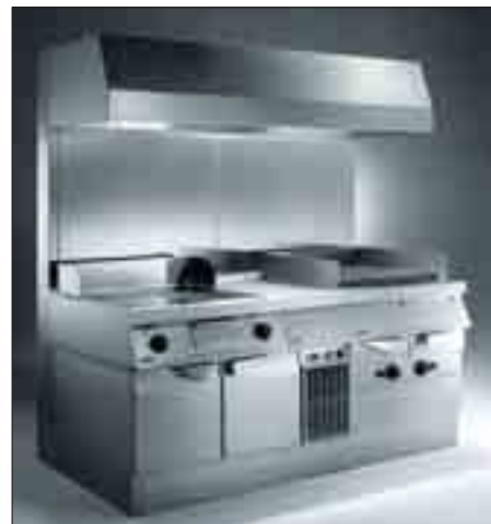
Stekning och grillningssystem

Kombinationen av olika enheter för fritering: 23-liter Active fritös, 15 liter fritös, neutral avställningsenhet och pommes frites värmariet för att hålla maten vid en konstant temperatur och för saltning kännetecknar Zanussi Professional friteringsystem. Produktiviteten kan varieras från 34 kilo per timme av fryst potatis till 60 kilo potatis av halvfabrikat. Den höga kvaliteten och smaken av friterad mat är garanterad av Active fritös fördelar med dess integrerade oljefiltersystem.