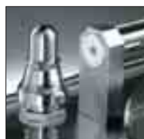
Säkerhetsventil för tryck i manteln