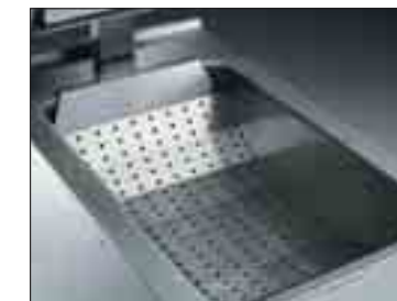
Uttagbar perforerad lös botten