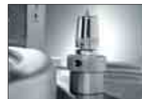
Ventil för luftutsläpp i manteln