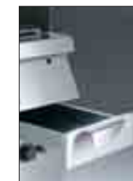
Stor utdragbar spillåda