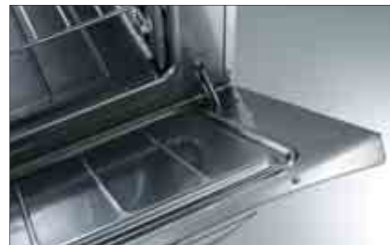
Ugnsutrymme med invändigt rundade hörn

Den elektriska ugnen har en hög standard med en effekt på 6 kW och en arbetstemperatur från 100°C till 300°C. Robusthet och enkel rengöring är garanterad av att ugnsutrymmet är i rostfritt stål (AISI 430). Isoleringen är garanterad av den 40 mm tjocka ugnsluckan. Ugnen är utrustad med tre gejderpar i rostfritt stål (AISI 430) anpassade för GN 2/1 galler. För förbättrad ergonomi är kontrollvreden placerade på den övre frontpanelen. För att garantera jämn tillagningstemperatur är ugnen försedd med en 5 mm tjock räfflad gjutjärns botten. Ventilen för klimatkontrollen garanterar alltid perfekt tillagning. Tre tillagnings möjligheter är tillgängliga, effektiv värmeöverföring från undersidan, grillning och en kombination av bägge.