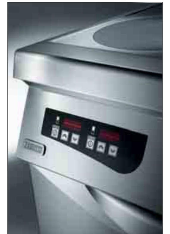
Kontrollpanel och keramisk häll

Energi för att värma upp 12 liter vatten från 20°C till 90°C.