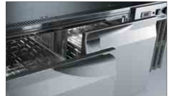
Stora draglådor på expansionbeslag

Kylbänken är försedd med 2 stora draglådor i rostfritt stål på expansionsbeslag, termostat, varningslampa för avfrostning och en ON/OFF brytare med varningslampa. Invändig temperatur varierar från -2°C till +10°C.