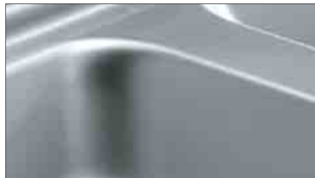
Slät pressad häll