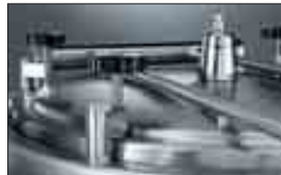
Autoklavlock med säkerhetsventil

Gas eller elektriska modeller, 250 liter, rektangulär med indirekt uppvärmning