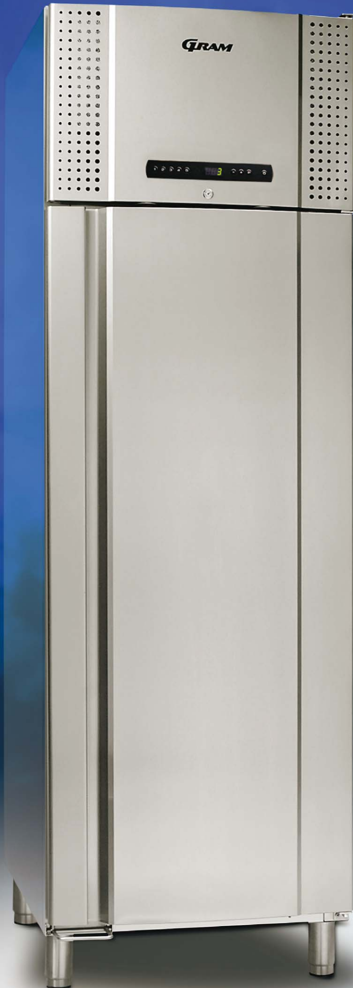
PLUS 660 CX