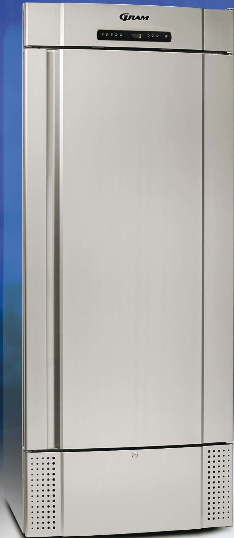
MIDI 625 CX