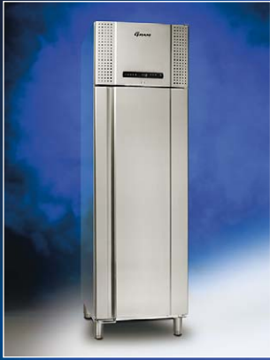
EURO 500 CX