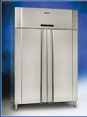
PLUS 1400 CX