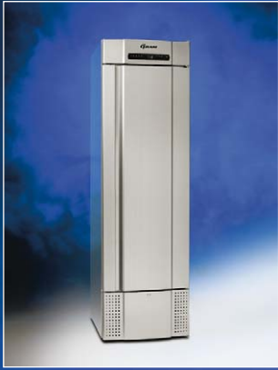
MIDI 425 CX