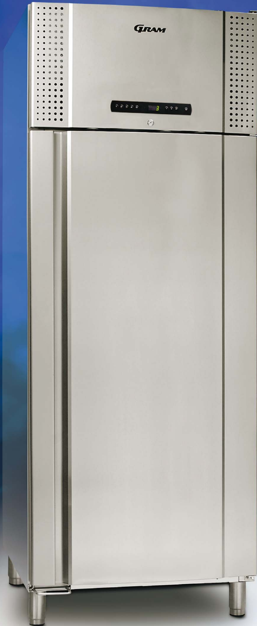
TWIN 660 CX