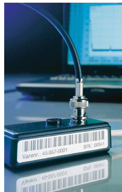
Gram Data logger